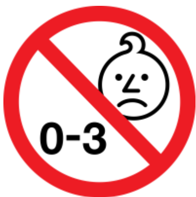
Figura 1: Símbolo gráfico de franja etaria inadecuada